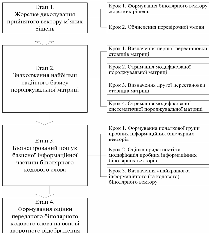
Рис. 1. Схеми біоінспірованого методу м'якого декодування лінійних блокових кодів на основі породжувальної матриці

Схему біоінспірованого методу м'якого декодування лінійних блокових кодів, що забезпечує візуалізацію основних його етапів та кроків, подано на рис. 1.