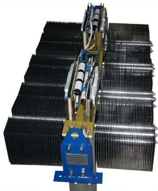
Рис. 10. Діодні блоки для випрямних установок тягових підстанцій постійного струму

Інтенсивно ведуться наукові дослідження з покращення електромагнітної сумісності тягових підстанцій постійного струму залізниць і міського електричного транспорту з живильною та контактними мережами. В основу досліджень покладено застосування спеціальних замкнутих систем автоматичного регулювання вхідних і вихідних координат керованого перетворювача електричної енергії. Теоретичні основи таких систем створені проф. Я.В. Щербаком.