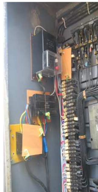
Рис. 3. Пристрій підвищення точності обліку і контролю електроенергії інформаційно-вимірювальним комплексом

— пристрій підвищення точності обліку і контролю електроенергії інформаційно-вимірювальним комплексом (рис. 3).