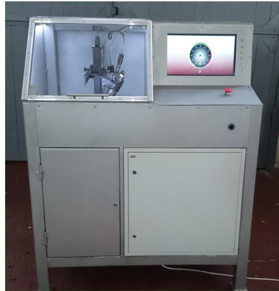
Рис. 8. Зовнішній вигляд мікропроцесорного автоматизованого стенду для контролю форсунок тепловозних дизелів

Для потреб локомотивних депо та проведення наукових досліджень у лабораторії розроблено випробувально-дослідницькі стенди з окремих вузлів паливної апаратури тепловозів, зокрема форсунок, паливних насосів високого тиску, їх плунжерних пар. Особливістю цих стендів є застосування у них мікропроцесорних систем для вимірювання параметрів та контролю процесу випробувань, що дозволяє з більш високою точністю аналізувати процеси у цих вузлах, здійснювати моделювання та розробляти ефективні алгоритми їх діагностування (рис. 8).