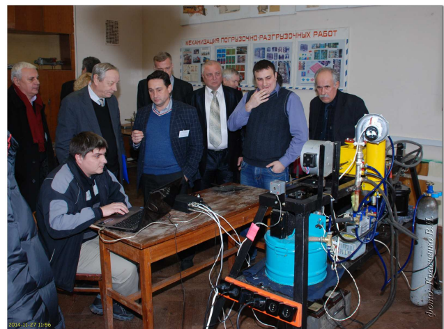
Рис. 5. Учасники міжнародної науково-технічної конференції «Нові технології, обладнання, матеріали в будівництві і на транспорті», присвяченої 80-річчю кафедри БКВРМ, обговорюють конструкцію стенду

Комплексне вирішення завдань, що висувуються в межах перелічених напрямів досліджень дозволить у найближчій перспективі отримати низку ресурсозберігаючих технологій для транспортної галузі України, що неодмінно підвищить її конкурентоспроможність на світовому ринку.