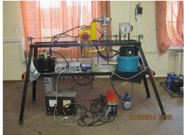
Рис. 4. Дослідницький стенд для отримання структурованих наночастинок вуглецю

— установлення раціональних режимів отримання наночастинок та створення рекомендацій щодо їх промислового виробництва;