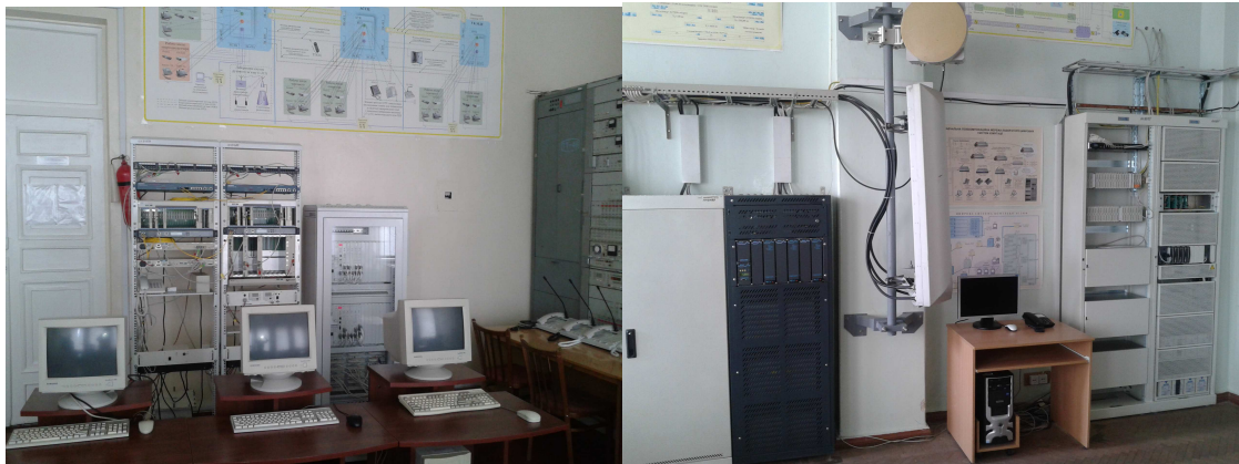
Рис. 2. Лабораторія цифрових систем передачі даних

телекомунікаційних технологій з метою підвищення ефективності використання та якості функціонування телекомунікаційних систем та мереж загального користування, інтелектуальних систем, а також систем та мереж технологічного зв'язку залізничного транспорту (рис. 2).