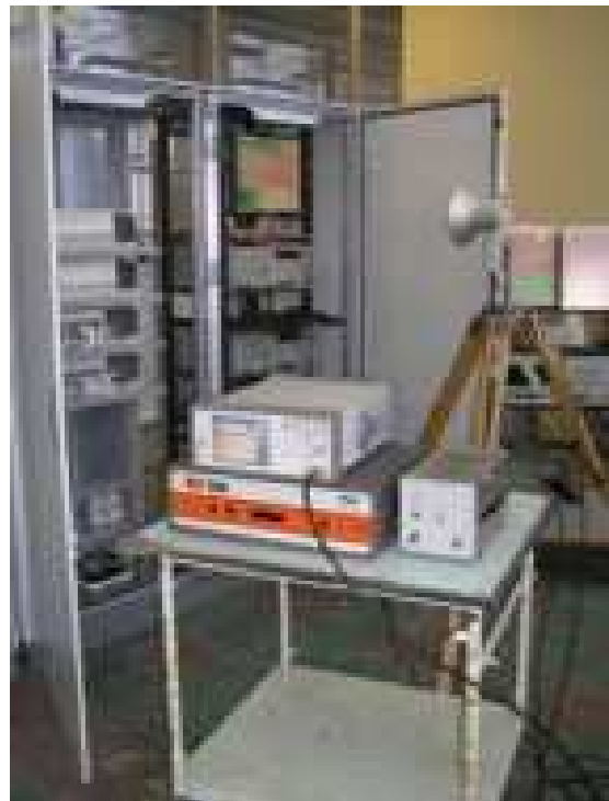
Рис. 1. Випробування системи мікропроцесорної централізації на електромагнітну сумісність

Значний обсяг робіт на кафедрі проведений також у напрямку розроблення і впровадження систем автоматичного оповіщення працюючих на коліях, пристроїв контролю та діагностування неоднорідностей електричних ліній, а також заходів щодо підвищення надійності рейкових кіл і точкових колійних датчиків. Науково-прикладні результати діяльності кафедри впроваджені у вигляді систем керування, діагностичних комплексів, нормативної та технічної документації на магістральному і промисловому залізничному транспорті, а також у суміжних відповідальних галузях народного господарства, зокрема в атомній енергетиці.