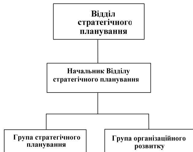
Рис. 1. Організаційна структура Відділу стратегічного планування

Беручи до уваги, що компанією, яка управляє інфраструктурою залізничної мережі та приймає рішення щодо розвитку мережі, є Укрзалізниця, базовою платформою реалізації системи стратегічного управління запропоновано прийняти саме її. В роботі пропонується в складі Головного пасажирського управління (ЦП) створити Відділ стратегічного планування. Організаційну структуру Відділу стратегічного планування запропоновано реалізувати за лінійно-функціональним принципом. До складу Відділу мають входити два підрозділи: група стратегічного планування та група організаційного розвитку (рис. 1).