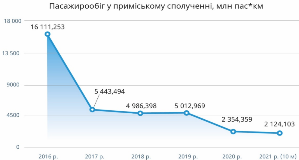
Рис. 1. Пасажиروبіг АТ «Укрзалізниця» у 2016-2021 рр.

Із початком пандемії COVID-19 з березня 2020 р. через запроваджені карантинні обмеження як країнами Європейського Союзу, так і Україною міжнародні пасажирські перевезення були зупинені і до листопада 2022 р. фактично не здійснювались.