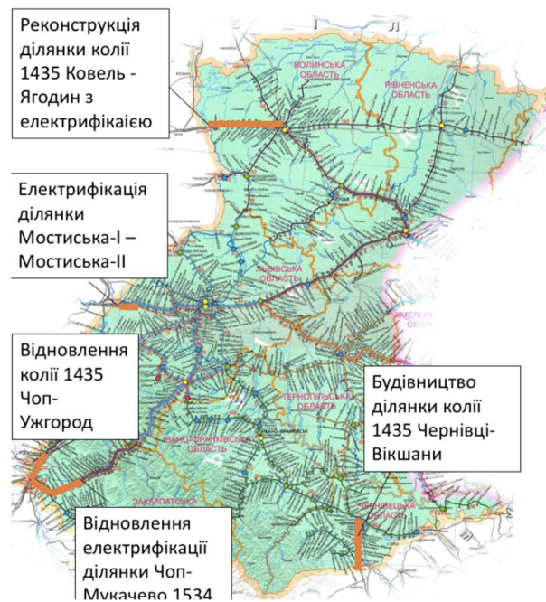
Рис. 3. Схема розміщення інфраструктурних проєктів, спрямованих на розвиток мережі міжнародних пасажирських перевезень

Розташування запропонованих інфраструктурних проєктів зображено на схемі рис. 3.