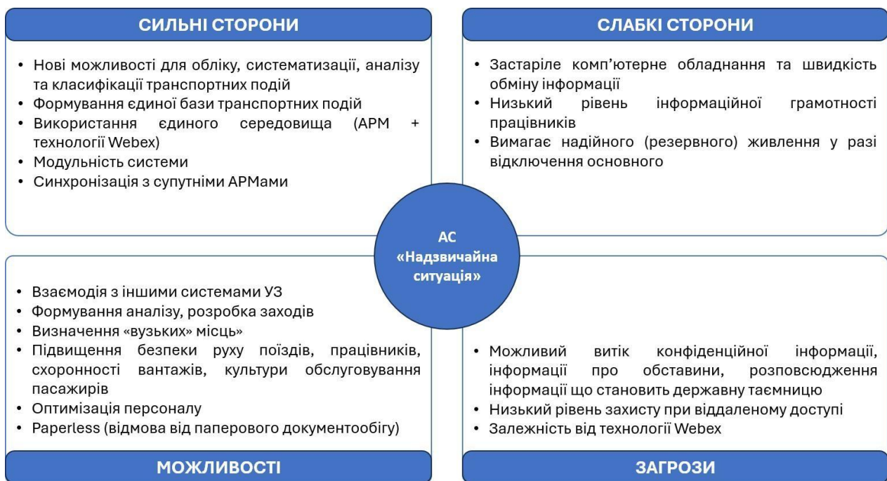
Рис. 1. SWOT-аналіз АС «Надзвичайна ситуація»

Впровадження АС «НС» передбачає реалізацію таких супутніх підсистем: АРМ «Транспортна подія», що забезпечує облік, систематизацію та аналіз транспортних подій; АРМ «Незаконні втручання» – реєстрація випадків несанкціонованого втручання в діяльність залізничного транспорту; АРМ «Крадіжка» у разі виявлення випадків розкрадання майна залізничного транспорту; АРМ «ДТП» для випадків виникнення дорожньо-транспортних подій на станціях, переїздах, а також за їхніми межами. На рис. 1 наведено запропонований SWOT-аналіз впровадження АС «НС».