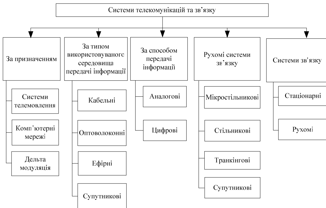
Рис.1. Схема класифікації систем телекомунікацій та зв'язку

набагато цікавіші перспективи для користувачів, ніж фіксований WiMAX, призначений для корпоративних замовників. Інформацію можна передавати на відстані до 50 км зі швидкістю до 70 Мбіт/с. У наш час WiMAX частково задовольняє умови мереж 4G, заснованих на пакетних протоколах передачі даних. До родини 4G відносять технології, які дозволяють передавати дані в стільникових мережах зі швидкістю вище 100 Мбіт/с і підвищеною якістю голосового зв'язку.