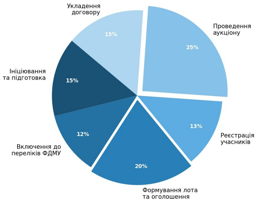
Рис. 2. Розподіл трудомісткості етапів електронного аукціону з оренди рухомого складу відповідно до Порядку № 483 (складено авторами)

Заключні розділи про продовження договорів, безаукціонну оренду, моніторинг і звітність відсилають до відповідних норм Закону № 157-ІХ, Порядку № 483 і Постанови № 634 [1, 2, 4], конкретизуючи їх для оренди вагонів. Розподіл трудомісткості основних етапів цього процесу показано на рис. 2.